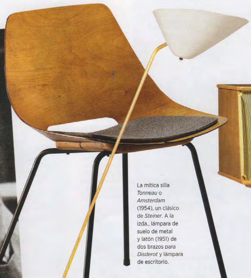
La mítica silla Tonneau o Amsterdam (1954), un clásico de Steiner . A la izda., lámpara de suelo de metal y latón (1951) de dos brazos para Disderot y lámpara de escritorio.