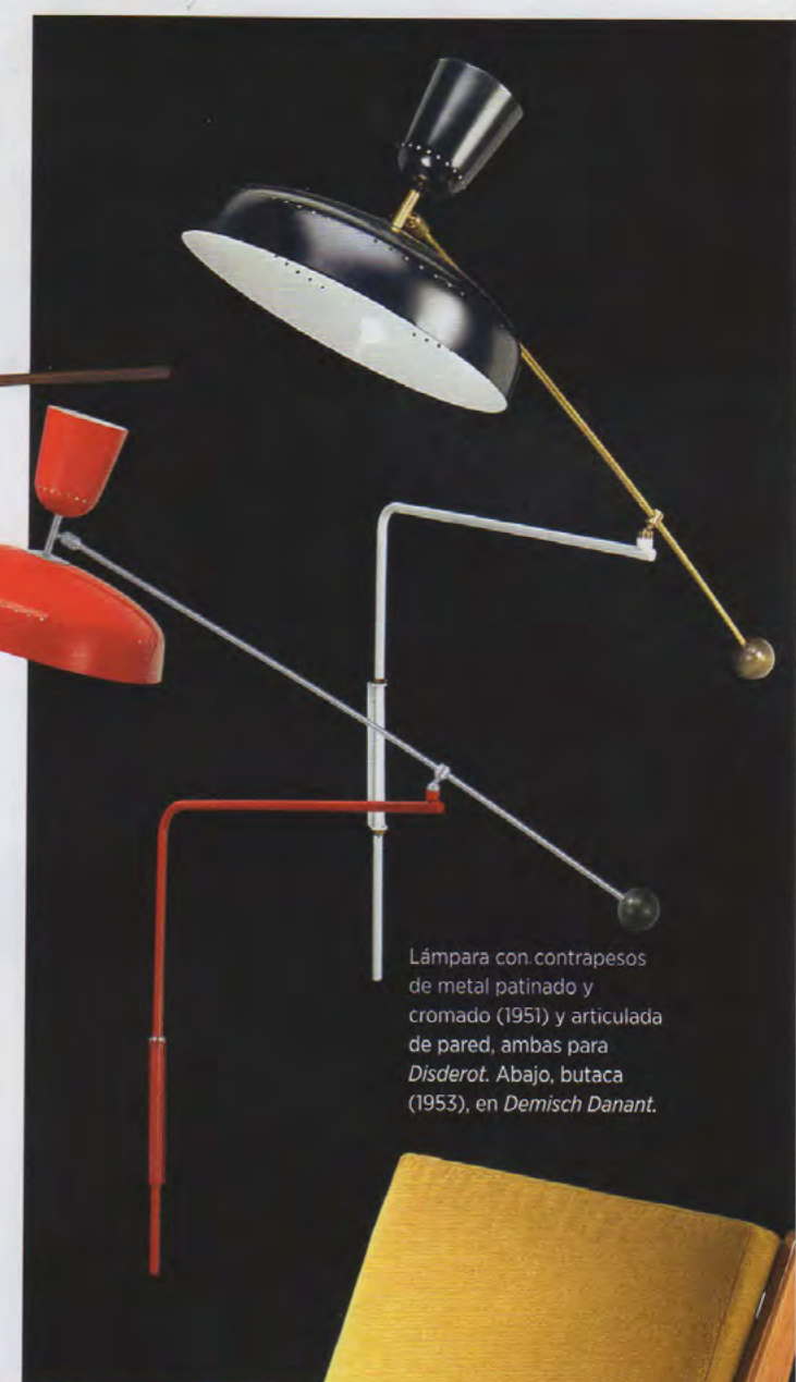
Lámpara con contrapesos de metal patinado y cromado (1951) y articulada de pared, ambas para Disderot . Abajo, butaca (1953), en Demisch Danant .

SUS LÁMPARAS-SOMBRERO DE HIERRO, COLORES BÁSICOS, ARTICULADAS Y ESCULTURALES, SON EL 'BOOM' AHORA EN FERIAS Y ANTICUARIOS.