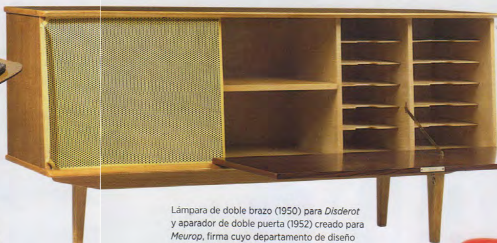
Lámpara de doble brazo (1950) para Disderot y aparador de doble puerta (1952) creado para Meurop , firma cuyo departamento de diseño capitaneó Pierre Guariche a finales de los 50.

Fue uno de los talentos emergentes de los 50, una generación optimista que miraba hacia el futuro a pesar de la devastación social de la Segunda Guerra Mundial. Pierre Guariche (París, 1926 - Bandol, 1995) fue un entusiasta de las posibilidades que se abrían gracias a las nuevas técnicas de producción industrial. El arquitecto y diseñador galo, nombre ilustre del Movimiento Moderno francés de posguerra, era de los que se sublevaba e intentaba dar con una alternativa a la opulencia de las artes decorativas tradicionales de Francia. Guariche entendía los objetos, no como piezas individuales, sino como elementos de un espacio vital único, siempre ataviado con una estética moderna. El creador ponía énfasis en la forma y el volumen, pero sus diseños reflejan un férreo compromiso con la simplicidad. Además se interesaba por la fabricación en serie, para abaratar los precios en una época donde el dinero no abundaba. Investigador imparable, fue el primer francés que introdujo la técnica para producir con contrachapado los asientos curvos y ergonómicos de una sola pieza —los bucvo — que ya diseñaba Charles Eames en Norteamérica