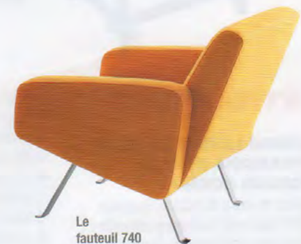
Le fauteuil 740 (1957), réédition Steiner.