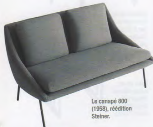
Le canapé 800 (1958), réédition Steiner.