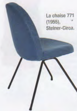
La chaise 771 (1955), Steiner-Circa.