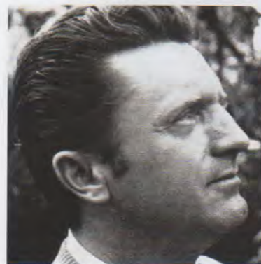
Joseph André Motte en 1969.