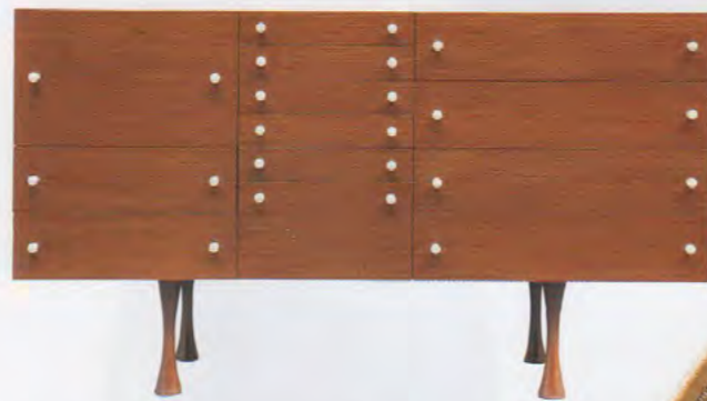
La commode "Evelyne" (1959). Charron

À cette même époque, plusieurs commandes d'Etat pour des collectivités publiques marquent un tournant dans la profession et dans le goût du public. D'abord, l'aménagement mobilier des sièges de l'aéroport d'Orly (1958/61) et celui de Radio France ainsi que la proposition pour la gare maritime du Havre (1963/64). En 1970, il reçoit