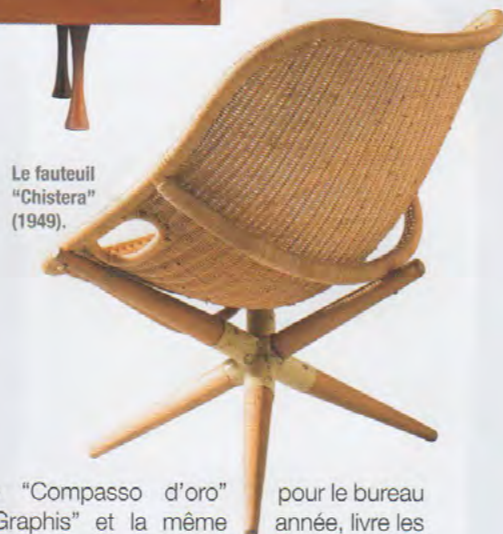
Le fauteuil "Chistera" (1949).

le "Compasso d'oro" pour le bureau "Graphis" et la même année, livre les Salons d'honneur de la Préfecture de Cergy Pontoise (1970) où trônent les célèbres tables basses en acier aux arêtes