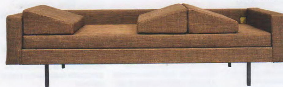
Le canapé/lit de repos modèle 900 (1960). Steiner