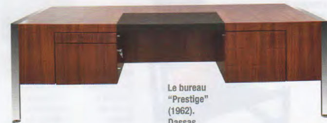
Le bureau "Prestige" (1962). Dassas